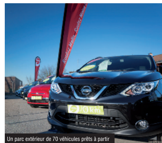
Un parc extérieur de 70 véhicules prêts à partir