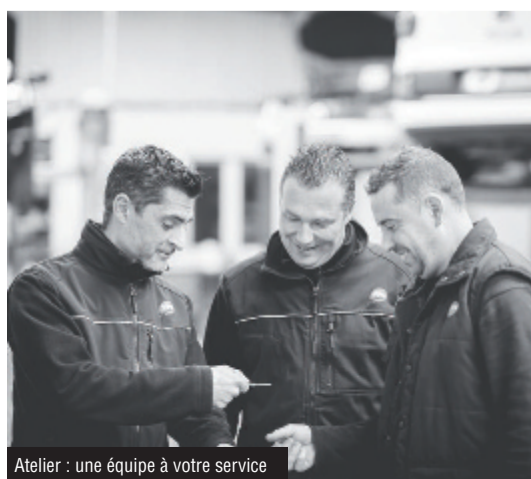
Atelier : une équipe à votre service